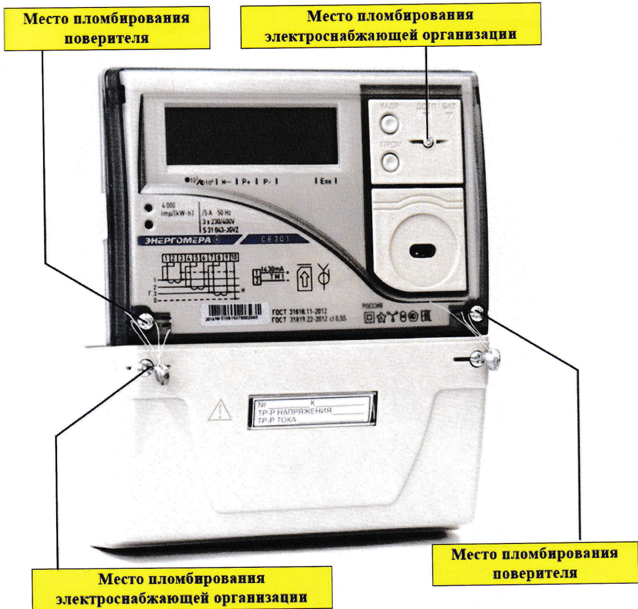
Рисунок 3 – Общий вид счетчика CE301 S31