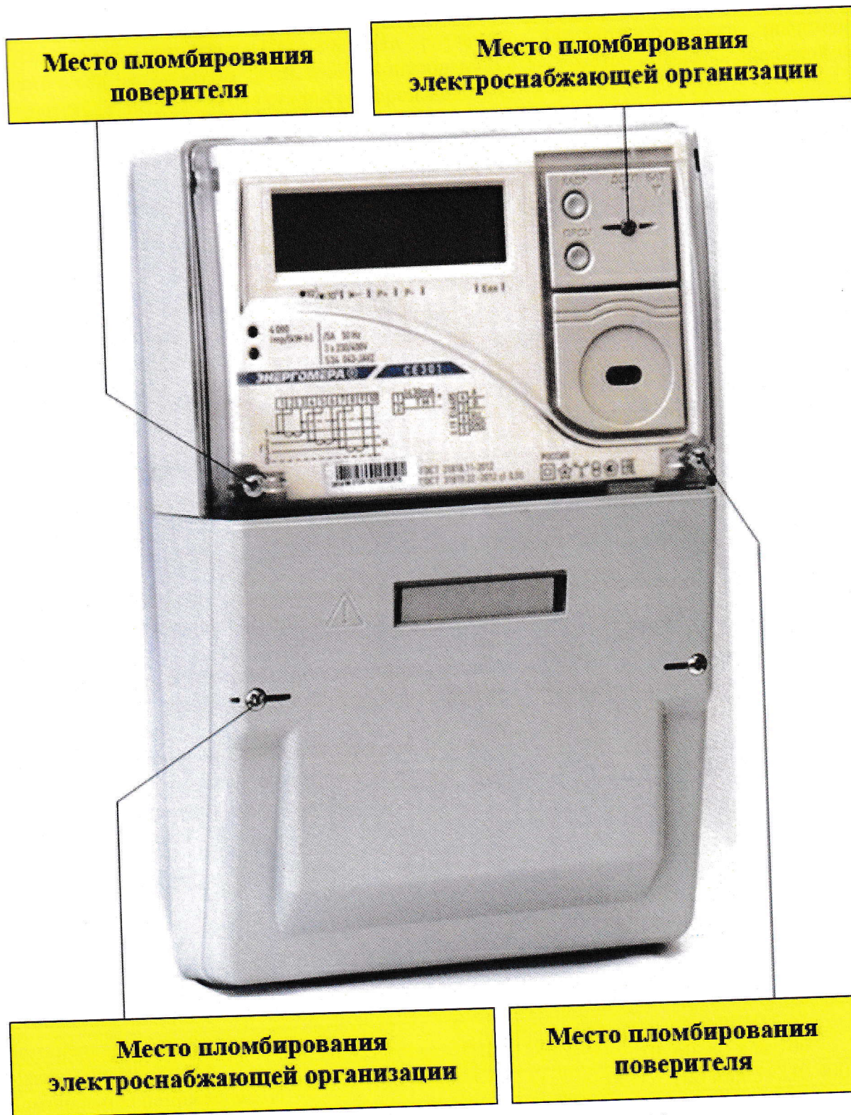
Рисунок 4 – Общий вид счетчика CE301 S34