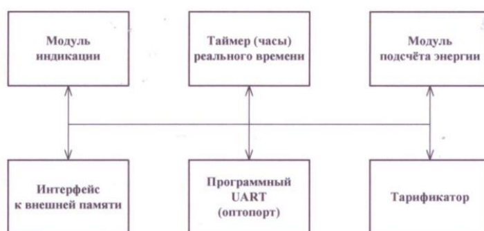
Рисунок 3 - Структура программного обеспечения «Меркурий 230»

Уровень защиты программного обеспечения от непреднамеренных и преднамеренных изменений «высокий» в соответствии с Р50.2.077-2014.