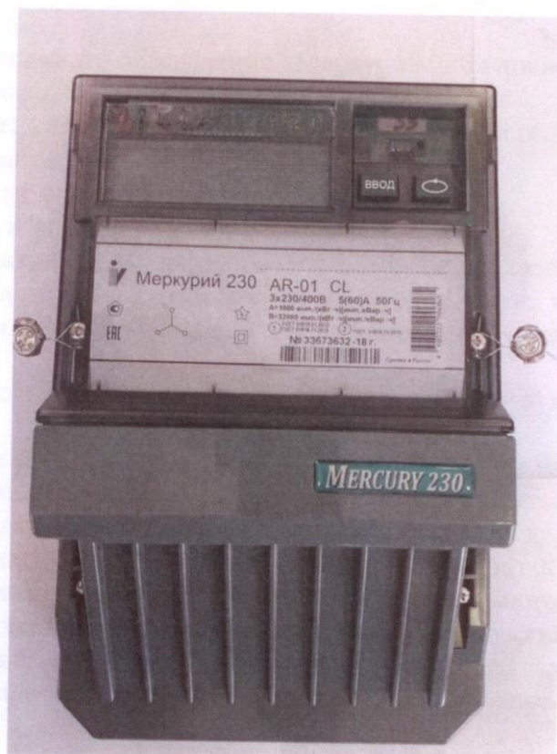
Рисунок 1 - Общий вид счетчика

Схема пломбировки от несанкционированного доступа, обозначение места нанесения знака поверки представлены на рисунке 2.