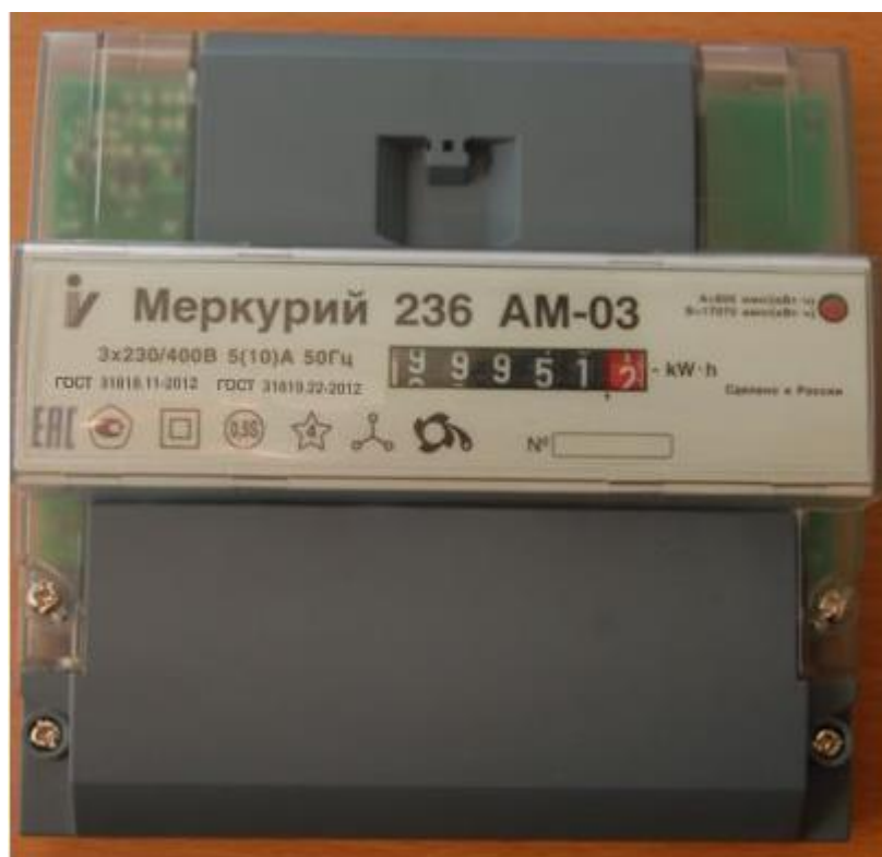
Рисунок 1 – Внешний вид счётчиков «Меркурий 236АМ-0Х»

Счётчики с жидкокристаллическим индикатором (ЖКИ) являются многотарифными и выпускаются с внешним или внутренним тарификатором и предназначены для учёта активной энергии прямого направления или активной энергии прямого направления и реактивной энергии прямого и обратного направления (таблица 2)