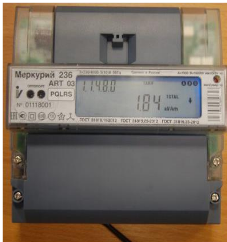
Рисунок 2 – Внешний вид счётчиков «Меркурий 236А(Р)(Т)...»

На рисунке 2 приведена фотография общего вида счётчиков «Меркурий 236А(Р)(Т)...».