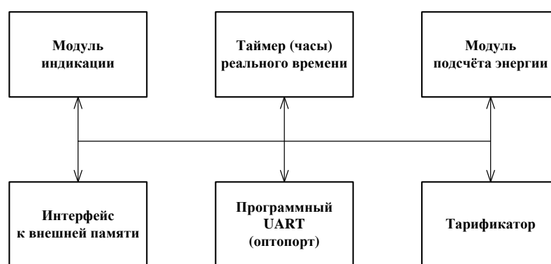
Рисунок 4 - Структура программного обеспечения «Меркурий 236»

Идентификационные данные программного обеспечения приведены в таблице 4.