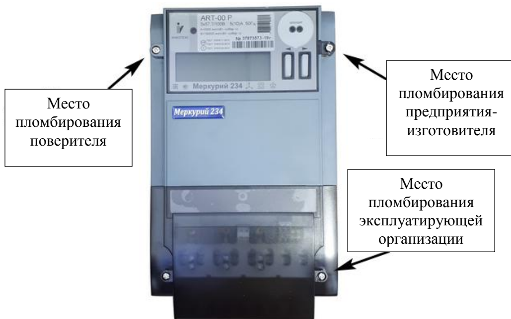
Рисунок 3 – Общий вид счетчиков модификаций «Меркурий 234» и «Mercury 234» с указанием мест пломбирования и нанесения знака поверки