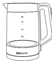
Серия «Нептун Плюс»